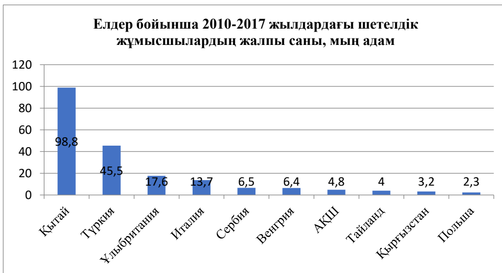
1 сурет – Елдер бойынша 2010-2017 жылдардағы шетелдік жұмысшылардың жалпы саны

негізделген деп айтуға болады. Қытай – Қазақстанға шетелдік жұмыс күшін тарту бойынша көшбасшы болып табылады: 2010-2017 жылдары елге 100 мыңға жуық қытайлық жұмысшы келді (барлық шетелдік жұмыс күшінің үштен бірі). Бұл осы көрсеткіш бойынша екінші орында тұрған Түркия көрсеткішінен екі есе артық (1 сурет).