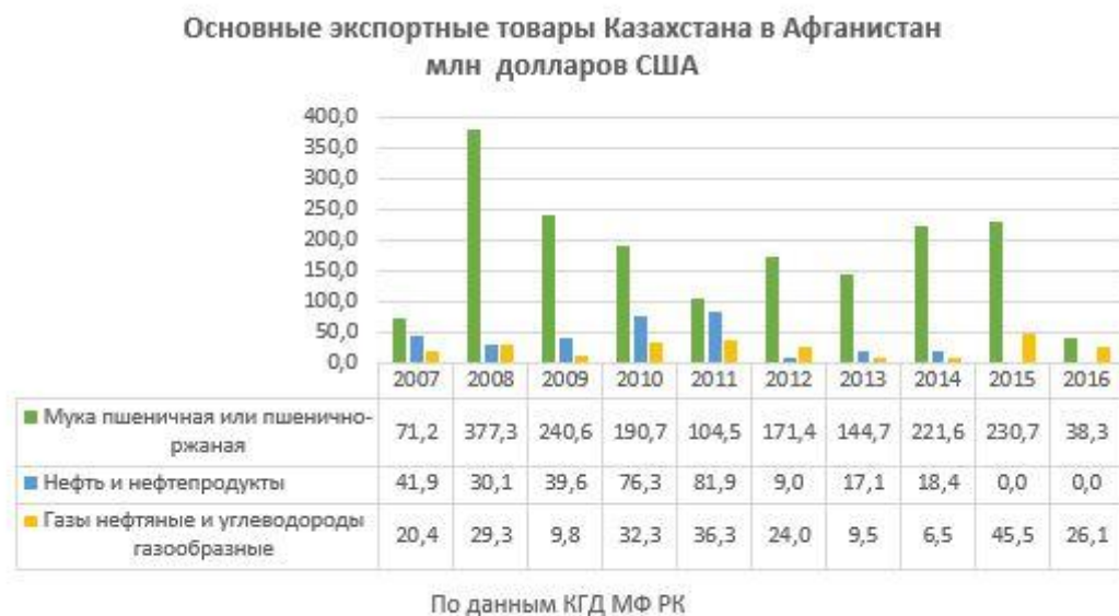
Рисунок 2 – Основные экспортные товары РК в ИРА в 2007–2016 гг. [13]

принятое ранее решение Казахстанско-афганской межправительственной комиссии по торгово-экономическому сотрудничеству [8]. Некоторое снижение товарооборота произошло в 2021 г. в связи с приходом к власти талибов, но затем он медленно стал восстанавливаться, однако составляя всего лишь около 0,7% всего внешнего товарооборота РК.