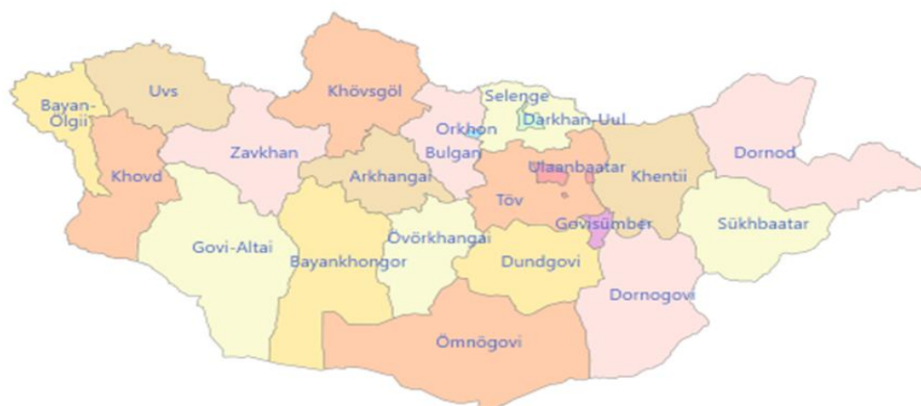
Рисунок 2 - Аймаки Монголии

расположенную недалеко от Улан-Батора. Большинство из них работают на местных заводах.