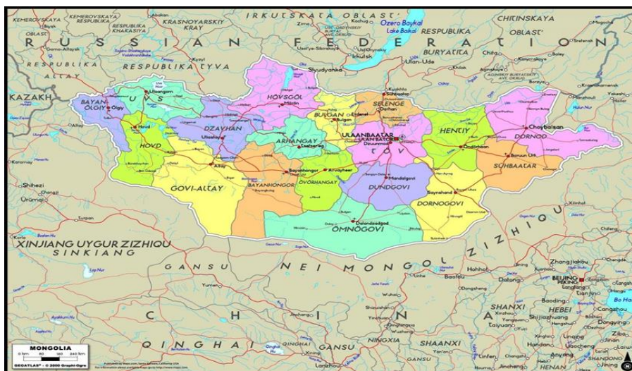
Административно-территориальная карта современной Монголии