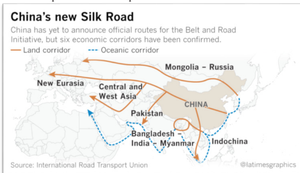
Map1 - Kazakhstan's position within the New Silk Road

Speaking at the Astana Economic Forum in Astana on May 22, 2015 the president of Kazakhstan Nazarbayev offered to create a new high-speed multi-modal transport route called the Eurasian transcontinental corridor. He noted, "It will run through the whole territory of Kazakhstan and will allow for the free transit of goods from Asia to Europe and back. This is much shorter than the maritime route" [11]. And here will arise new opportunities for Kazakhstan, because as noted by specialists, the land route will be much shorter than the maritime route - almost three times" [11].