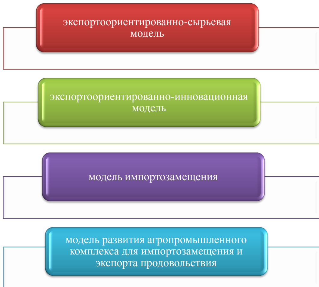
Рисунок 1 - Модели экономического развития

В Казахстане стихийно сложилась и осуществляется первая модель. Экспортно-ориентированное развитие - тот тип эволюции экономики, при котором ставка делается на конкурентоспособные на мировом рынке производства, на вывоз соответствующей продукции, обеспечивающей ресурсы для других, значительно более слабых, отраслей. При этом предполагается высокая степень открытости хозяйственной жизни внешнему миру. По отношению к Казахстану такими «конкурентоспособными производствами» стали исключительно сырье и продукция неглубокой переработки.